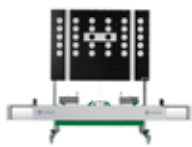
Hella Gutmann CSC-TOOL SE