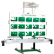
Hella Gutmann CSC-TOOL DIGITAL